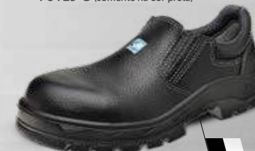
50T19 C OU CPAP 70T19 C (somente na cor preta)