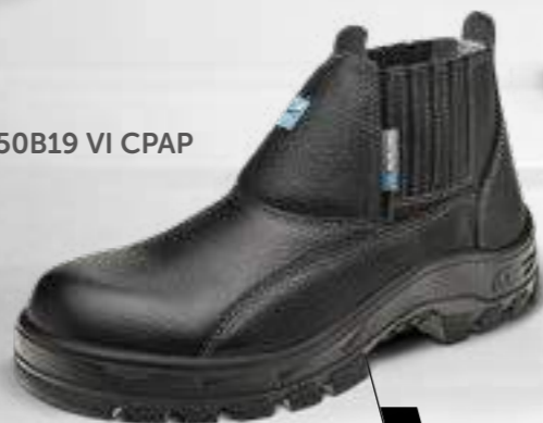
50B19 VI CPAP