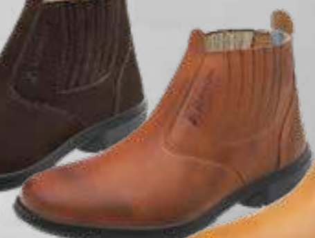
55AG19 EC LP