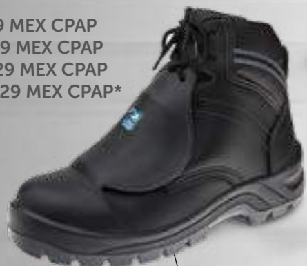
50B29 MEX CPAP 60B29 MEX CPAP 70B29 MEX CPAP 30B29 MEX CPAP*