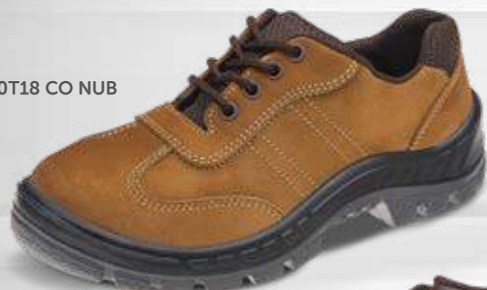
50T18 CO NUB