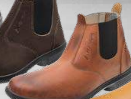
55AG19 EA LP