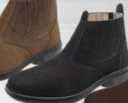
55AG19 EC NP