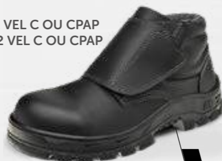
50B22 VEL C OU CPAP 70B22 VEL C OU CPAP