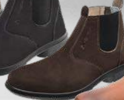
55AG19 EA NCE