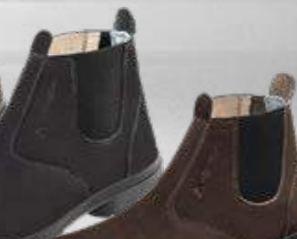
55AG19 EA NP