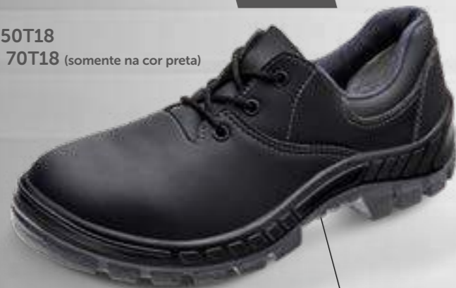
50T18 70T18 (somente na cor preta)