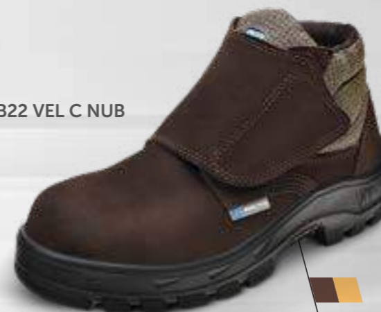
50B22 VEL C NUB