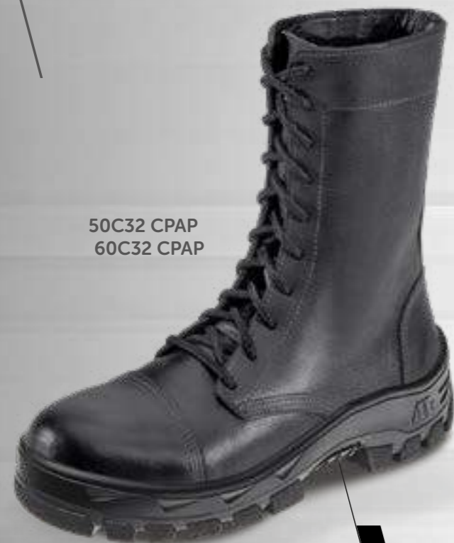
50C32 CPAP 60C32 CPAP