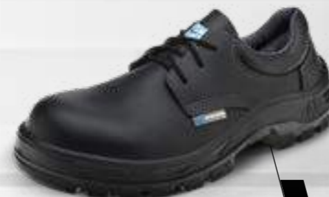
50S29 C OU CPAP 70S29 C OU CPAP 30S29 CPAP*