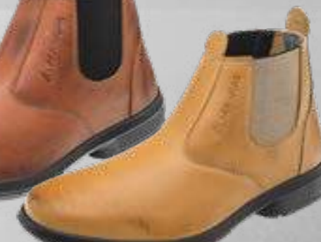
55AG19 EA LC