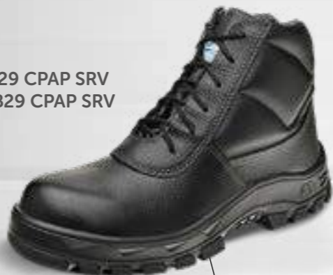
50B29 CPAP SRV 60B29 CPAP SRV