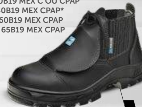
50B19 MEX C OU CPAP 70B19 MEX C OU CPAP 30B19 MEX CPAP* 60B19 MEX CPAP 65B19 MEX CPAP