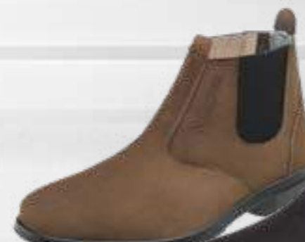
55AG19 EA NT