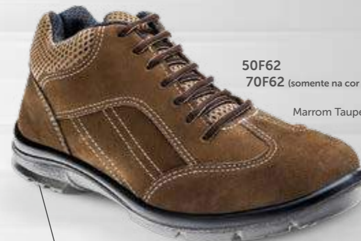
50F62 70F62 (somente na cor preta)

Cabelado em couro e microfibras, mais leve e respirável, forro interno com reforço acolchoado, solado em PU Bidensidade antiderrapante que garante estabilidade e amortecimento. Muito mais conforto para aumentar seu desempenho no dia a dia.