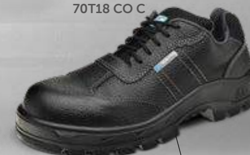
50T18 CO C 70T18 CO C