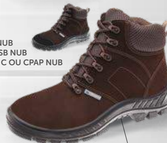
50B26 NUB 50B26 SB NUB 50B26 C OU CPAP NUB