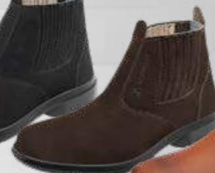
55AG19 EC NCE