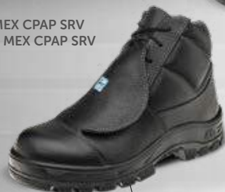
50B29 MEX CPAP SRV 60B29 MEX CPAP SRV