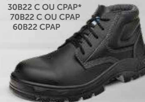
50B22 C OU CPAP 30B22 C OU CPAP* 70B22 C OU CPAP 60B22 CPAP