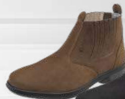
55AG19 EC NT

Trabalho no campo é para quem tem coragem e está sempre pronto para qualquer desafio. Você é assim. A Agriwork também. Uma nova linha de calçados criada, especialmente, para garantir proteção e conforto aos trabalhadores do agronegócio.