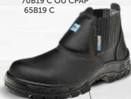
50B19 C OU CPAP 60B19 C OU CPAP 30B19 C OU CPAP* 70B19 C OU CPAP 65B19 C