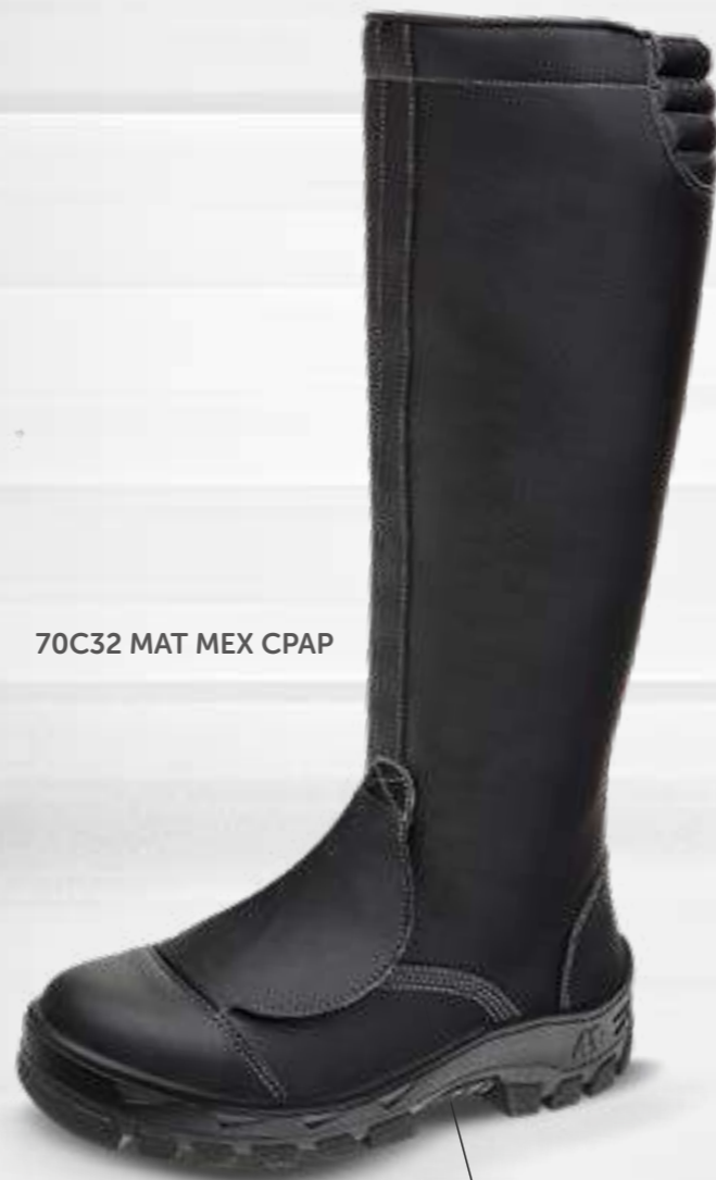
70C32 MAT MEX CPAP