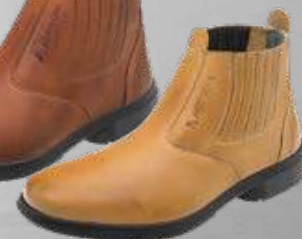
55AG19 EC LC