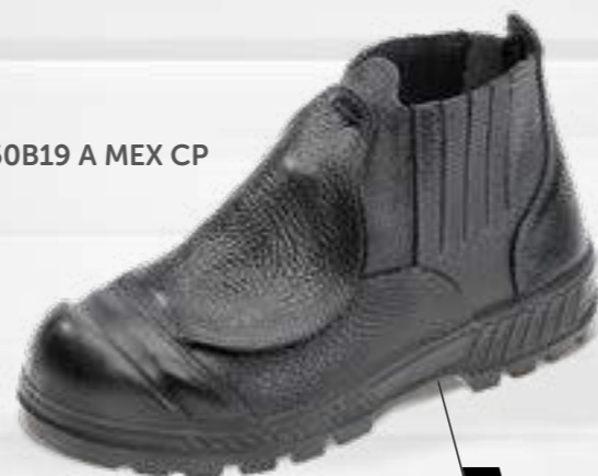
50B19 A MEX CP